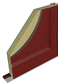
LUMMERHÖJDEN Ur serien Tradition