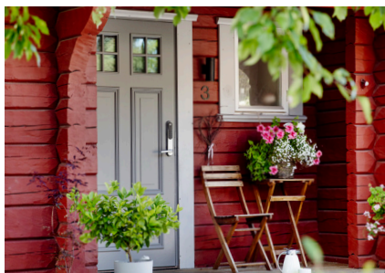
SKEBERG Ur serien Tradition

Där hittar du också vår katalog ( alla bilder i katalogen finns att få högupplösta ).