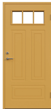
MON Ur serien Tidlös