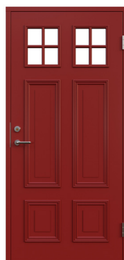
SKEBERG Ur serien Tradition